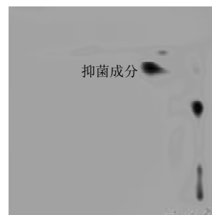
图 1 二维薄层色谱 Fig.1 2D- TLC