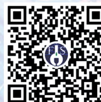
食品科学微信视频号