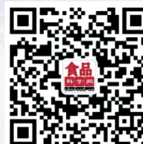
食品科学微信服务号